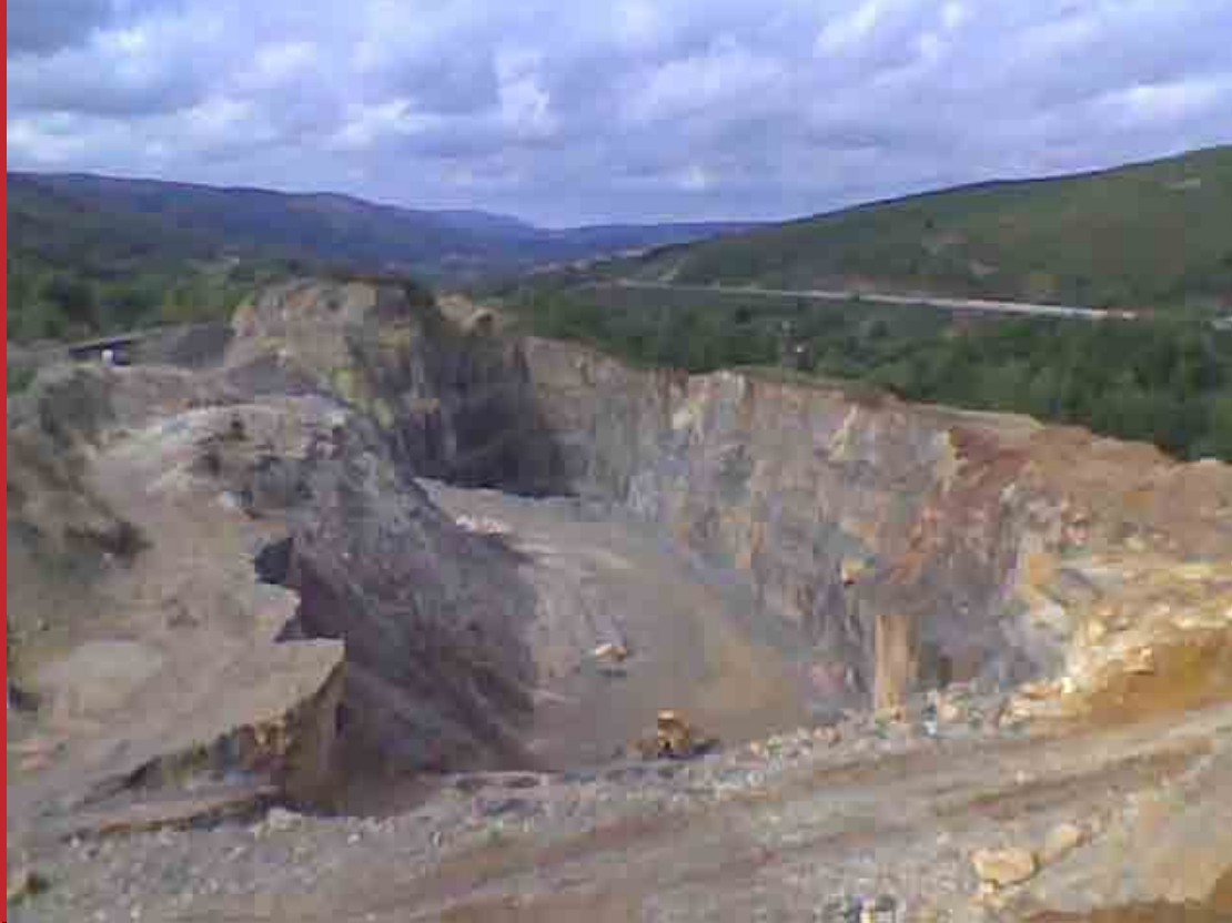
El gran cañón Emilio E. Aragón Deago