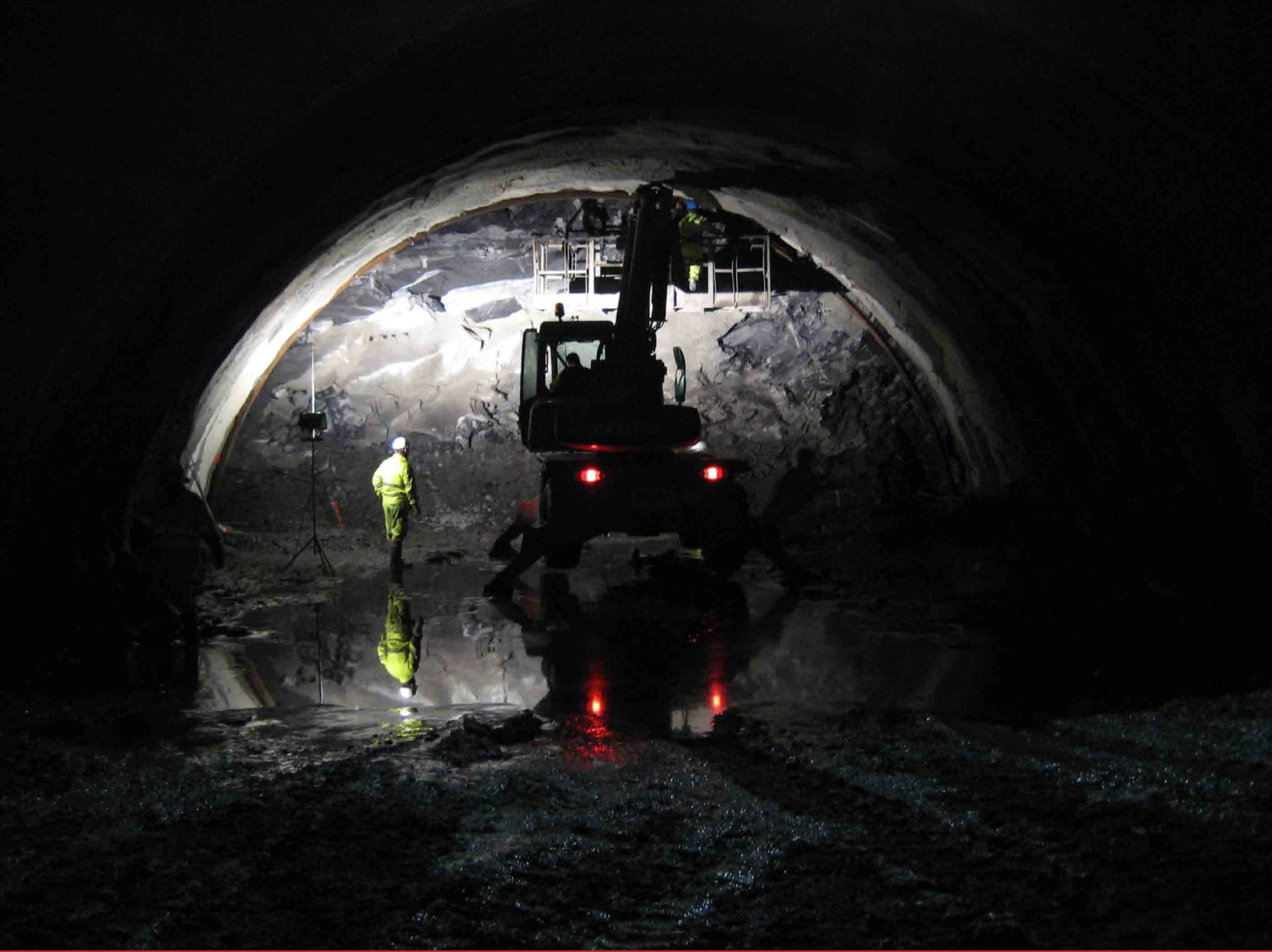
A pie de obra Rosaura Díaz Díaz