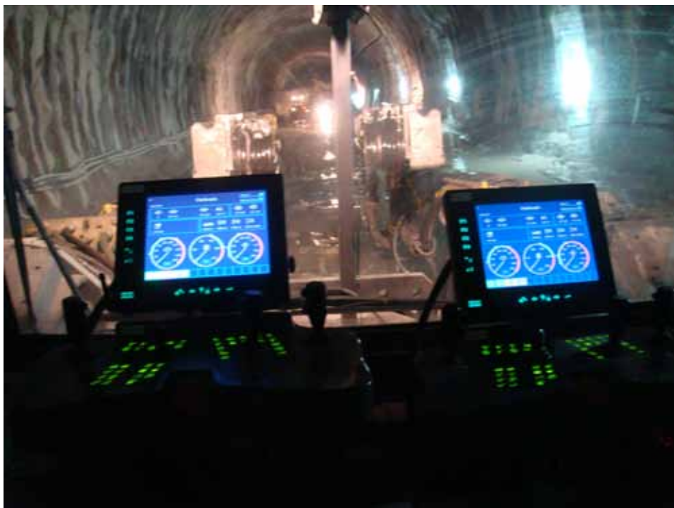
Juego de adultos Rosaura Díaz Díaz