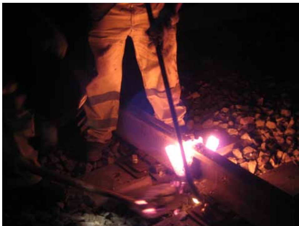
Soldadura Rosaura Díaz Díaz