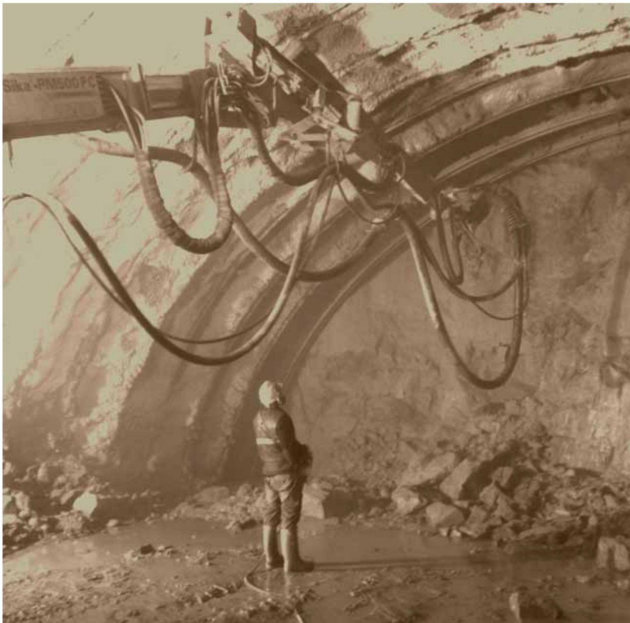
Entre latiguillos Rosaura Díaz Díaz