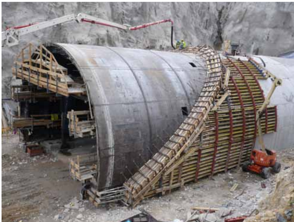
Elaboración Beatriz López Cubero